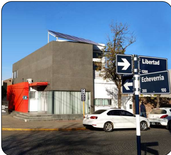
Colegio de Ingenieros Especialistas de Córdoba - Sede San Francisco 41,6 Kwp