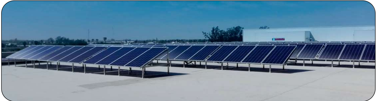
La Piamontesa 41,6 Kwp