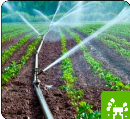
Irrigación de cultivos.