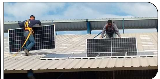
Instalación de Kit Solar en Tambo Modelo del Grupo Mharnes en Villa María, Córdoba 126 Kwp