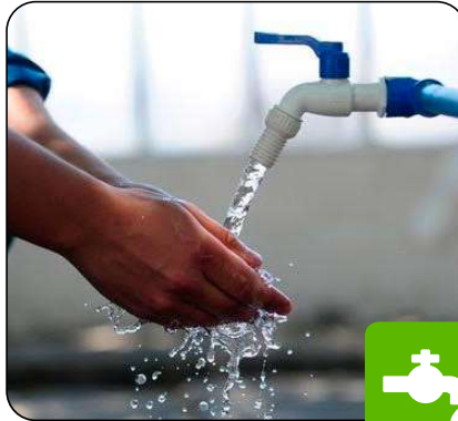
Abastecimiento de agua en zonas alejadas.