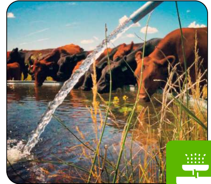
Bebederos para Animales